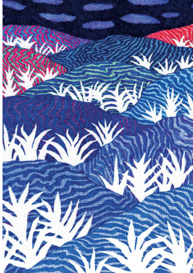
©Kevin Lucbert, "Fleurs de nuit", 21 x 29,7cm, encre sur papier, 2022

L'art incarne-t-il l'inconscient ? Une chose est certaine, les artistes sont des passeurs de rêves et des traducteurs de la psyché humaine rendant sensible l'inexprimable.